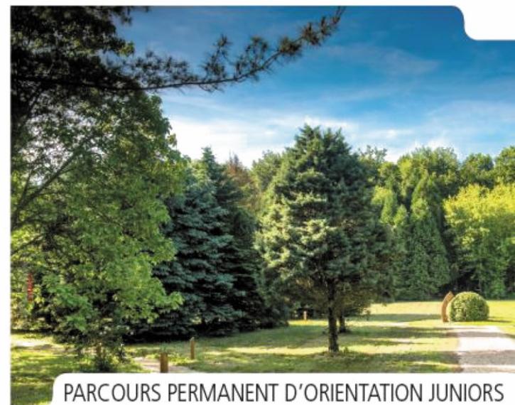
PARCOURS PERMANENT D'ORIENTATION JUNIORS